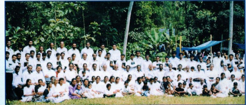
Vi støtter evangelister og pastorer fra Filadelfia bevegelsen i Kerala. De arbeider i 5 forskjellige Indiske provinser.