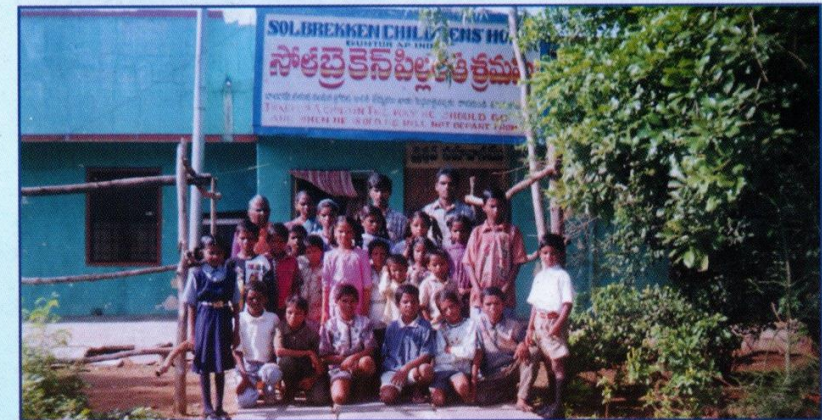
Siden 1966 har vi støttet 'Solbrekken Barnehjemmet' in Guntur, Andrah Pradesh.

Skriv til - Europa For Kristus Postboks 60, Hauketo 1206 Oslo, Norge Postgiro: 7877 08 56964